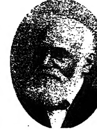
هكذا بدأتنا مع توفيلوس فولد مازر